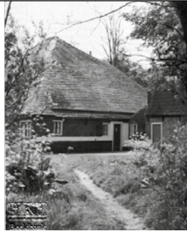
Een van de 15 foto's boerderij Admiraal