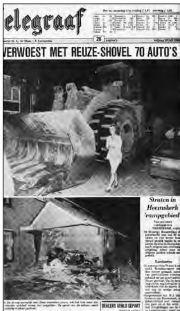
De Telegraaf ruimde een groot deel van de voorpagina in voor de shovelramp

Immers: hij is in november 1991 geboren en toen de shovel zijn verwoestende werk deed was zijn moeder zwanger van hem... En, vertelde hij er nog bij, de auto van zijn ouders was door de shovel meer dan tien meter meegesleurd. Albert Jansen, de schrijver van het interessante artikel, gaf desgevraagd uitsluitsel over de datum. Het gebeurde inderdaad in 1991, in de nacht van 17 op 18 juli.