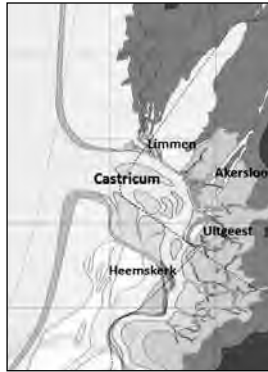
Ter hoogte van Castricum mondde het Oer-IJ in zee uit

In totaal zijn er vijf routes, allemaal met als thema 'Water'. Vanwege dit uitgangspunt zijn er informatiepunten van PWN en Hoogheemraadschap Hollands Noorderkwartier. Daarnaast spelen ook deze keer op diverse plekken acteurs de (lokale) geschiedenis na. De meeste wandelroutes doen ook Heemskerk aan, en dan met name kasteel Assumburg. Op die plaats zal de HKH zich uiteraard doen gelden.