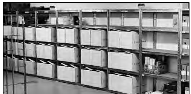
Deel van ons depot in de Gerrit van Assendelftstraat