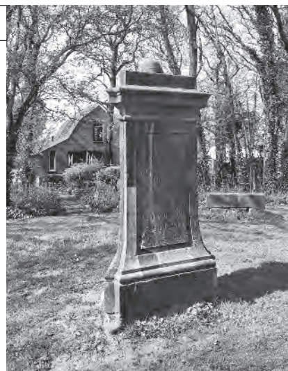
Het Huldstoneel nu

land. In dubbel opzicht zelfs, want naast de heuvel kreeg ook de drie- zijdige hardstenen zuil-met-in- scriptie de status van rijksmonu- ment. Wie vandaag de dag het Huldstoneel bezoekt, komt al snel tot de conclusie dat dit bijzonde- re monument wat in de vergetel- heid is geraakt. De gemeente al- thans heeft zich er niet al te veel aan gelegen laten liggen. Veel Heemskerkers weten niet eens waar ze het Huldstoneel moeten zoeken. Een stijlvol sierhekwerk aan de Rijksstraatweg, over de volle breedte van de huidige haag, met het woord HULDSTONEEL