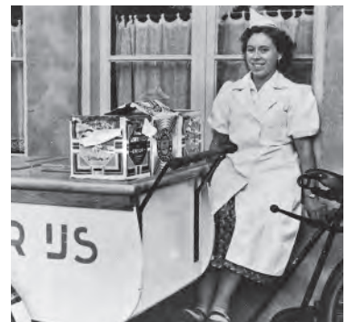
Wat is Afra's achternaam?