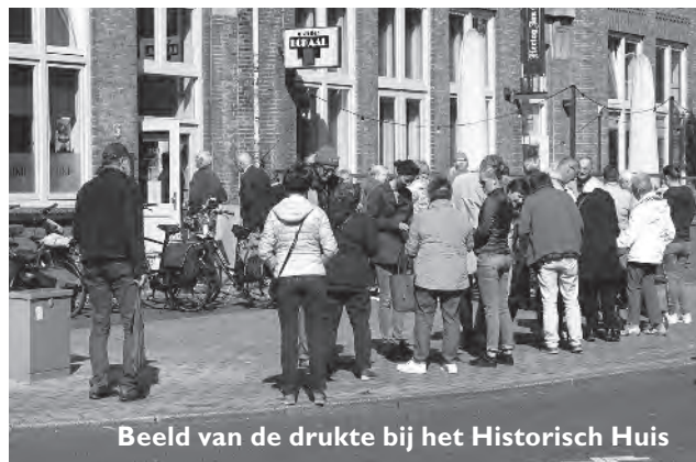
Beeld van de drukte bij het Historisch Huis

Zo konden we de meeste plaatjeszoekers alsnog aan hun ontbrekende nummers helpen.