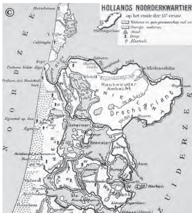
Noord-Holland in de dertiende eeuw. Rechts van de N van Noordzee staat: Het Huldstoneel der Kennemers

U hebt het vast al wel ergens gelezen of gehoord: de HKH wil van het Huldstoneel weer een plaats maken waar van alles gebeurt. Het nu wat ver- scholen liggende, vrijwel vergeten monument met zijn indrukwekkende verleden moet hoognodig weer op de kaart gezet worden.