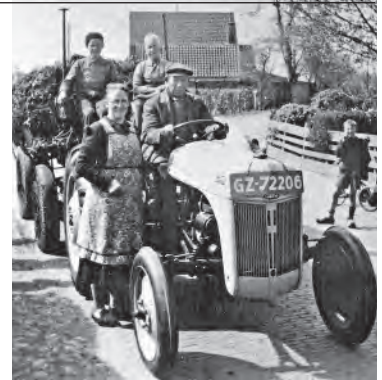
Hoe heet de familie op en om de tractor?